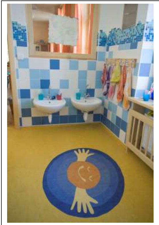
Interiér předsiňky toalet. Z přírodního linolea se dají vyřezávat různé tvary a obrázky.

materiál vhodný pro všechny druhy podlah. Linoleum je kolem 3mm silné a dají se z něho vyřezávat i barevné vzory a obrazy. V interiérech udržuje volné záporné ionty, protože je elektrostaticky neutrální. Povrch se dá vytírat a udržuje se voskovými emulzemi.