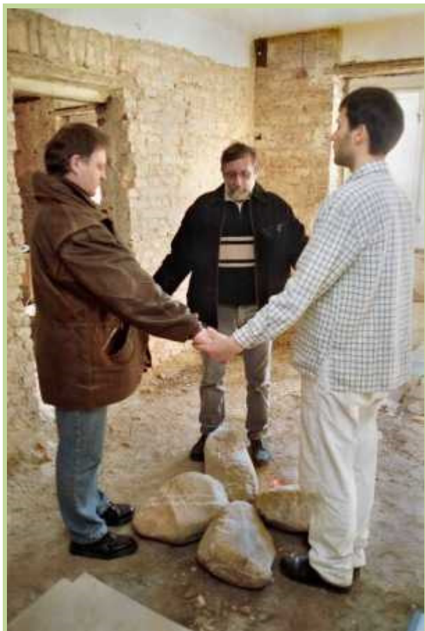
Úroveň citových sil (psychická rovina). Průběh rituálu pro příznivé započetí stavby za účasti majitelů. Centrum Ajurvédského lékařství v Praze.