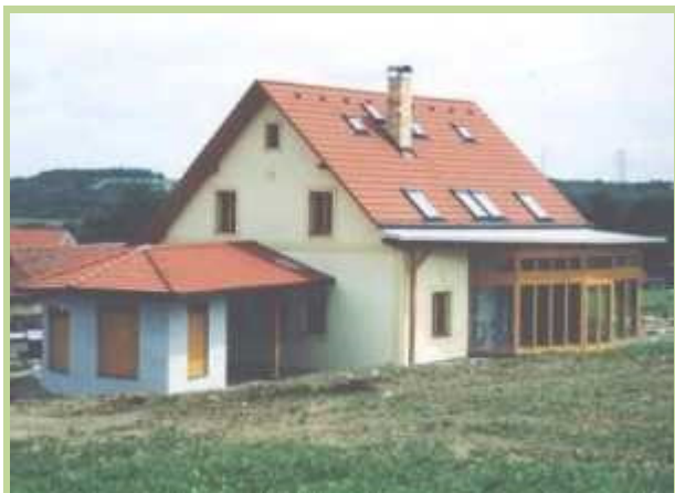
Pohled na nízkoenergetický dům z jihozápadu (nízkoenergetický rodinný dům u Prahy).

Jaká je dnešní představa lidí o bydlení? Do jaké míry bere člověk současnosti v úvahu stav civilizačního vývoje ve vztahu ke svému stylu života? Jak a podle čeho hodnotí kvalitu obytného prostoru?