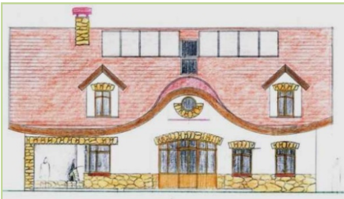
Fyzická úroveň - pohled na nízkoenergetický dům z jihu. (Studie rodinného domku v Brandýse nad Labem).

Ekologická řešení a výše zmíněné aspekty na úrovni materiální jsou důležité, avšak pro celistvé pochopení prostorových kvalit stále nedostatečné. Máme-li plně pochopit vlastnosti prostředí, je třeba se zabývat i dalšími složkami jeho jemnomotných kvalit.