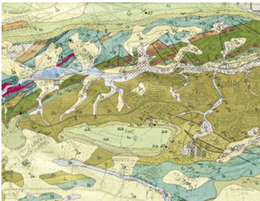
Geologické podloží krajiny podél motolského údolí. Černé plné čáry jsou linie geologických zlomů, na kterých by se nemělo stavět.